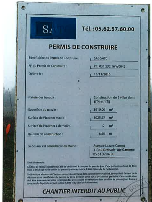
Vue rapprochée du panneau