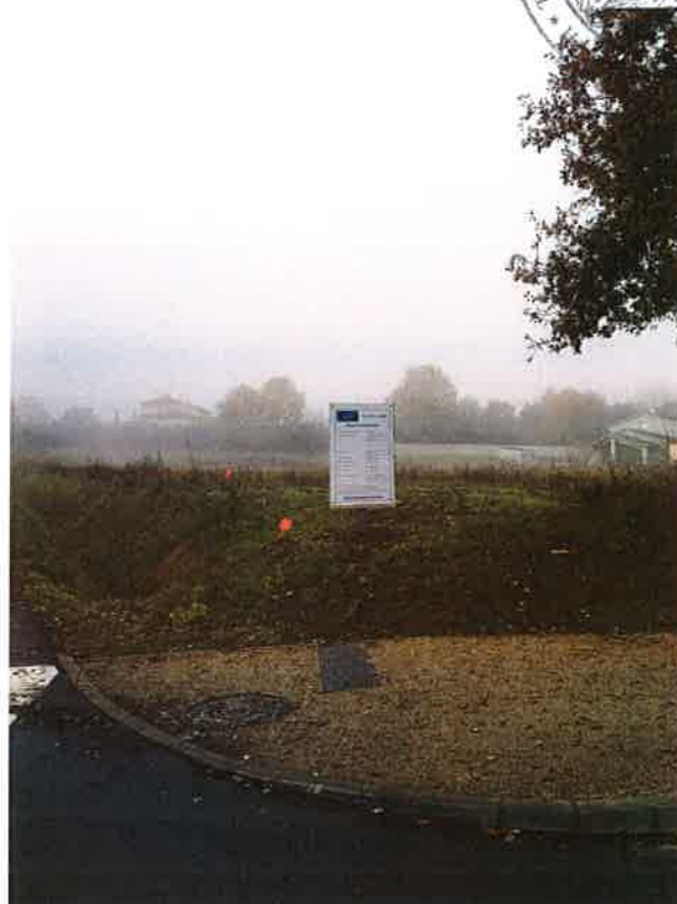
Vue du panneau depuis la chaussée